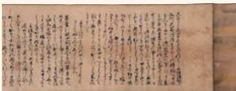
『幽斎公道記』 〈幽斎自筆「九州道の記」の冒頭部分〉