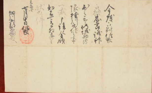
細川藤孝の領知を保障した「天下布武」の朱印状 《織田信長朱印状》元龜4年(1573) 永青文庫所蔵 熊本大学附属図書館寄託/前期展示