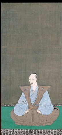
秀吉が描き改めさせた? 信長の肖像 《織田信長像》狩野永徳筆桃山時代(16世紀) 大徳寺所蔵/後期展示

KUMAMOTO PREFECTURAL MUSEUM OF ART 熊本県立美術館 [本館] 〒860-0008 熊本市中心区二の丸2番 TEL.096-352-2111 FAX.096-326-1512 http://www.museum.pref.kumamoto.jp