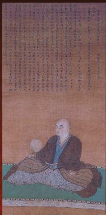
信長に仕えた細川家初代・藤孝の姿 《細川藤孝(藤孝)像》慶長17年(1612) 天授庵所蔵/前期展示