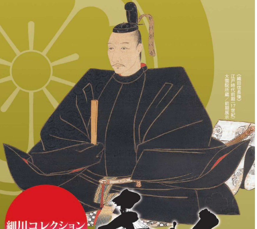
（織田信長像） 江戸時代前期（17世紀） 大森院所蔵／前期展示