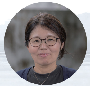
コメント 奥羽 香織氏 ((一社)水俣・写真家の眼 事務局)