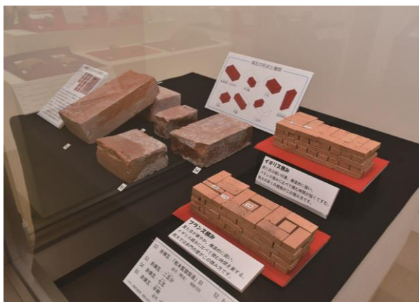
近代の煉瓦と煉瓦模型展示