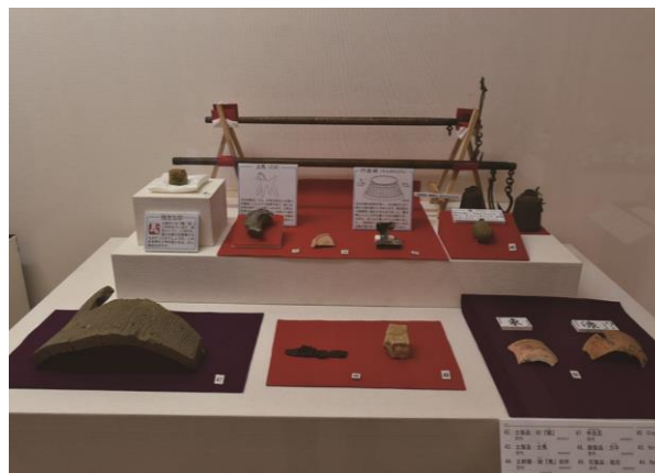
奈良・平安時代の遺物展示